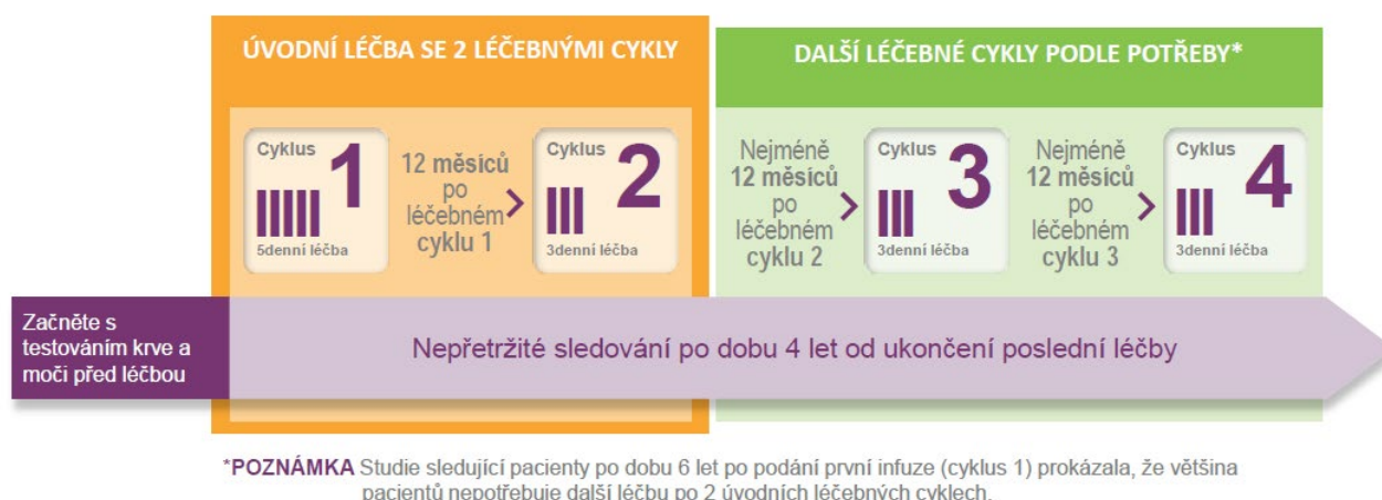
Schéma uvedené níže srozumitelně ilustruje dobu trvání účinků léčby a dobu nutného sledování.

Přípravek LEMTRADA bude podáván formou infuze do žíly. Každá infuze bude trvat přibližně 4 hodiny. Ve sledování nežádoucích účinků a pravidelném testování je však třeba pokračovat po dobu 4 let po poslední infuzi.